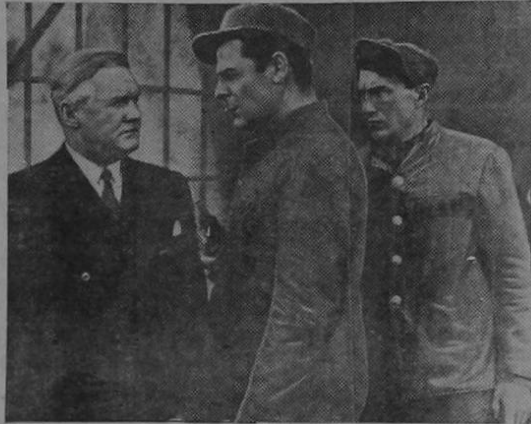
Bryan DONLEVY, que comparte los honores con la encantadora Jacqueline WELLS en el nuevo film Columbia "Idilio Tras las Rejas", aparece en esta escena con Joseph VREHAN, el alcalde de la prisión donde BRYAN pasa una temporada, y Paul FIX, audaz ladrón.

laron sus estatutos y cumplieron fielmente sus reglamentos, fue de resultados positivos; pero ahora, dado a la circunstancia apuntada y contra la voluntad de sus dignatarios, se vió obligada a cerrar sus puertas pero ojalá que sea para abrirlas nuevamente con mayor entusiasmo y amor fraternal del que cuando se fundó, para evitar la caída en el abismo de muchos hombres útiles a la humanidad, que están destinados a llegar a la cumbre con el auxilio espiritual de estas instituciones.