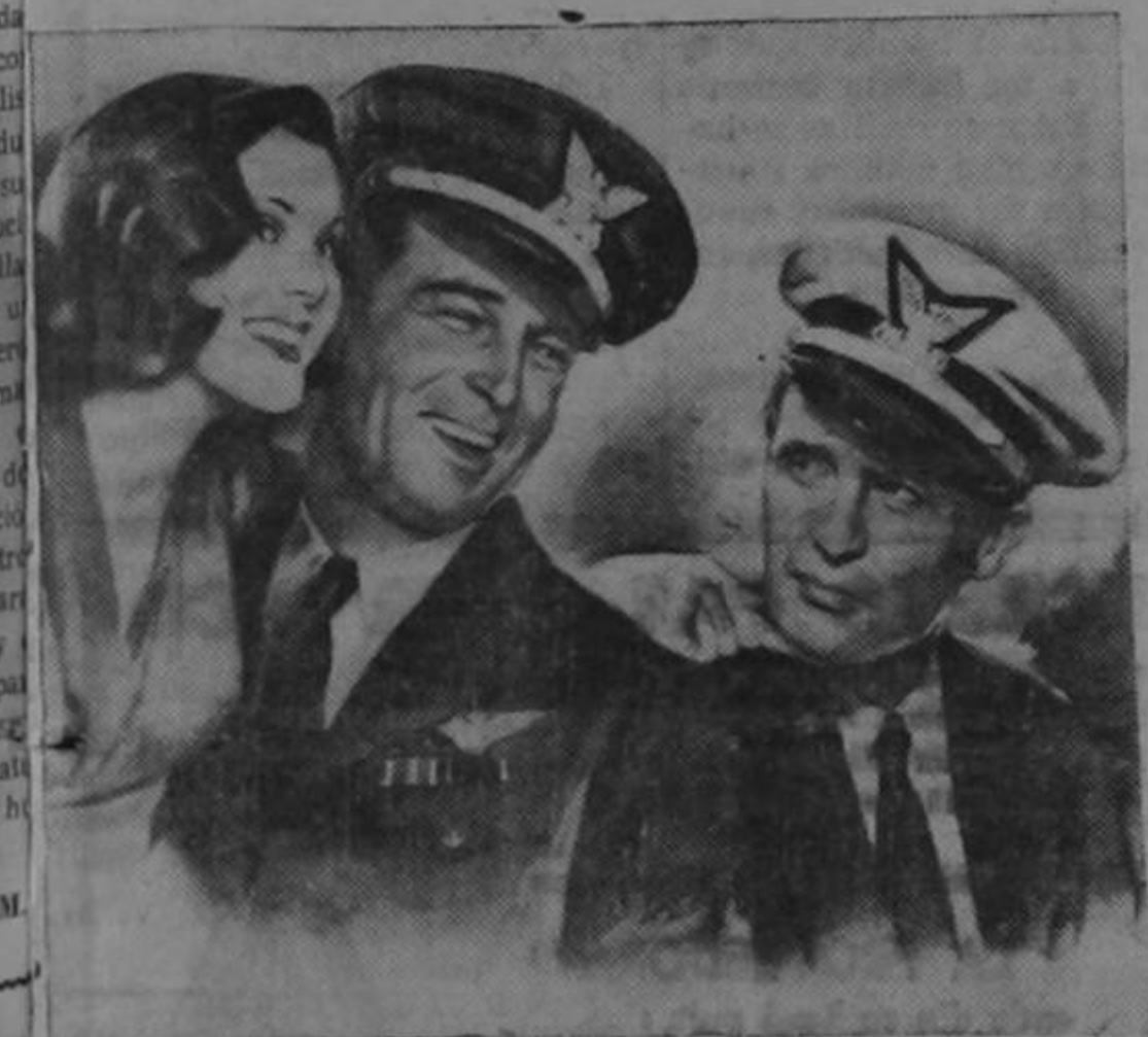
Ralph BELLAMY no parece estar muy complacido con el tratamiento que recibe de manos de Frances DEE y Randolph SCOTT en esta escena tomada de la película Columbia "Vigilias del Mar". El veterano y popular actor Walter Connolly también forma parte del reparto de este espectacular film.

británicos y que un torpedero tuvo que detenerse, a más de que un buque tanque quedó tan estropeado que sus tripulantes debieron abandonararlo, y que en un barco de abastecimientos explotó la caldera. Agrega que los ataques británicos al aerodromo de Trondheim dañaron los aviones alemanes.