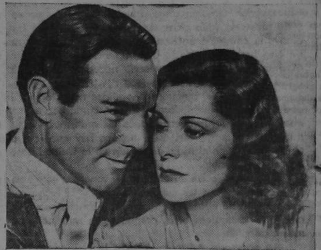
Frances DEE pertenece a ese pequeño grupo de mujeres que han logrado conquistar una carrera y... un marido y ambas conquistas han sido realizadas con gran éxito. En esta foto la vemos con Randolph SCOTT en una amorosa escena de "Vigias del Mar", la película Columbia en la cual esta encantadora pareja deleita al espectador con sus románticas aventuras.

El perfeccionamiento gradual y progresivo, es la ley invisible que rige los destinos del hombre, en los mundos existentes. Todo aquello que pueda mejorar nuestra condición natural y moral sobre la tierra; todo lo que de a la ciencia, a la industria y a las artes un impulso considerable hacia el perfeccionamiento de los conocimientos intelectuales y de los instru-