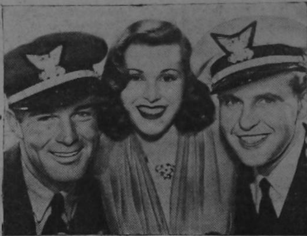
El romántico trio que protagoniza los roles principales de "Vigias del Mar", Randolph SCOTT, Frances DEE y Ralph BELLAMY. Rivales en el amor, Randolph y Ralph arriesgan su vida juntos para que otros puedan vivir... Walter CONNOLLY también tiene un rol importante en este magnifico film Columbia.

nido gran fé en el desarrollo de la industria pecuaria en esta provincia. Era uno de los capítulos del programa de incremento económico de la zona, que publicamos y analizamos largamente el año anterior. Por eso miramos esta gestión, que tiende a convertir en realidad aquellas aspiraciones explanadas ampliamente en las columnas de este semanario, con toda simpatía. Y por lo mismo hemos de ayudar a convertir en ley de la república esa iniciativa que se anuncia.